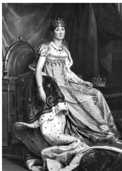
Josefina de Beauharnais. Obra de François Gérard.

Sin embargo, en tus cartas del 23 y 26 de Ventoso, me tratas de vos. ¡ Vos también tú!