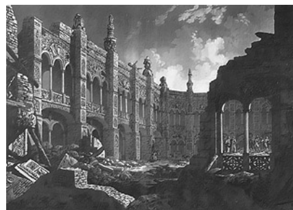
Ruinas de Zaragoza. Gálvez y Brambila.

El 14 del mismo mes, el comisario general de policía y corregidor de la ciudad, publicó unas nuevas ordenanzas de policía, elaboradas por él, para toda la ciudad y los barrios.