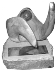
Aragonés del año Cultura 2008