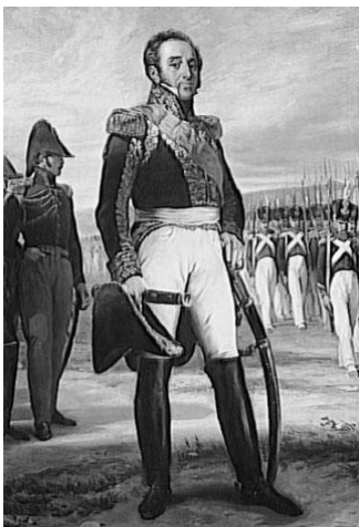
Louis Gabriel Suchet. Obra de Jean-Baptiste Paulin Guérin.