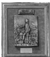
Premio Palafox 2014