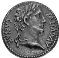
Premio UV Cesaraugusta