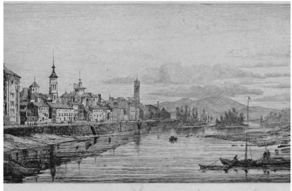
“Barcas a la orilla del río”, de Rafael Monleón. Al fondo, la grúa.

Puerto fluvial de la Zaragoza de principios del siglo XIX.