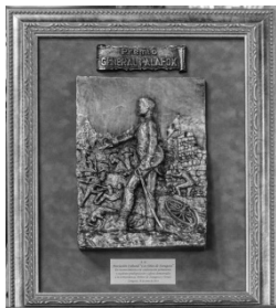
Premio Palafox 2014