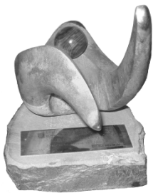
Aragonés del año Cultura 2008