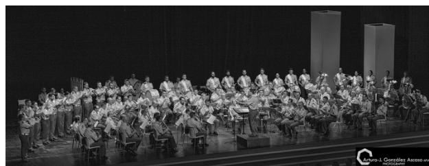
Las tres Unidades juntas interpretando la segunda parte del concierto.

General Militar, la Banda de Música de la Academia de Infantería de Toledo y la Banda de Guerra de la Brigada Aragón I. Una brillante y emotiva actuación, que acabó siendo jaleada por los aplausos del público mientras se coreaba la popular letra de "Las corsarias" y mostraba su total respeto en la interpretación, a la finalización del concierto, del Himno de España.