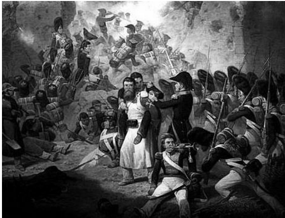
La conquista del Convento de Santa Engracia (detalle). Jan Suchodolski.

Tendrá lugar en el Salón de actos de la Parroquia de Santa Engracia, c/ Hernando de Aragón, 6 (esquina con Paseo de la Constitución).