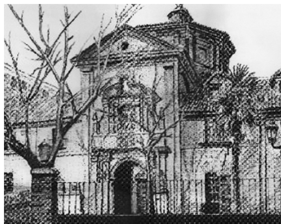
Iglesia del Hospital de N.ª S.ª de Gracia.

Posteriormente el antiguo Hospital de Convalecientes, tomó el nombre de Nuestra Señora de Gracia, como recuerdo y homenaje al original fundado en 1425, nombre con el que se sigue conociendo actualmente.