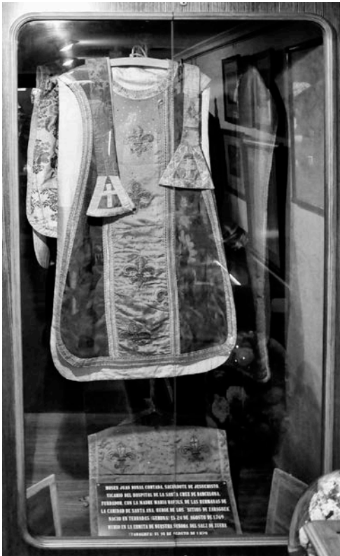
Casulla del Padre Bonal, confeccionada con banderas francesas.

(Intervienen: Madre Superiora de la Congregación; Directora de la Fundación Padre Bonal).