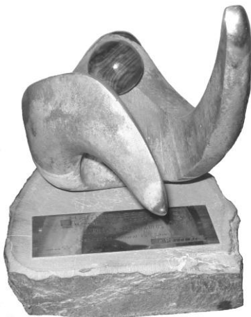
Aragonés del año Cultura 2008

Para todos, socios, amigos y simpatizantes, un fuerte abrazo,