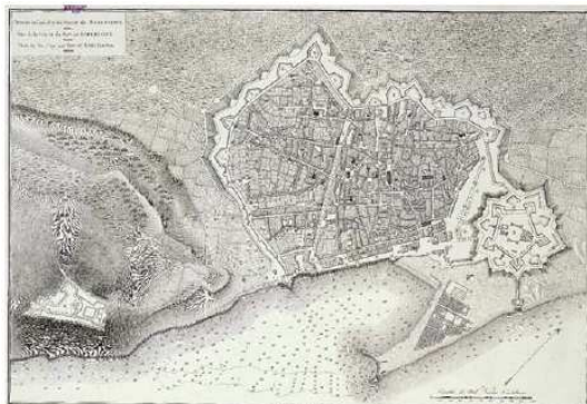
Barcelona en 1806.

puntos a fin de asegurar las comunicaciones a retaguardia, por lo que los ejércitos debían ocupar físicamente posiciones y plazas fuertes que normalmente habrían dejado atrás.