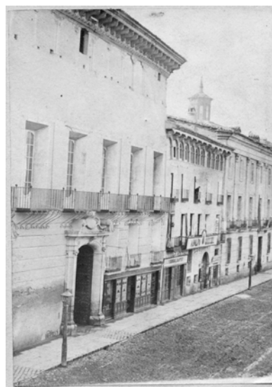
Residencia de Suchet (edificio al lado del Palacio de Sástago).

6. 11:45h. Central del Banco Santander. Antiguo Palacio de Suchet durante la ocupación 1809-1813.