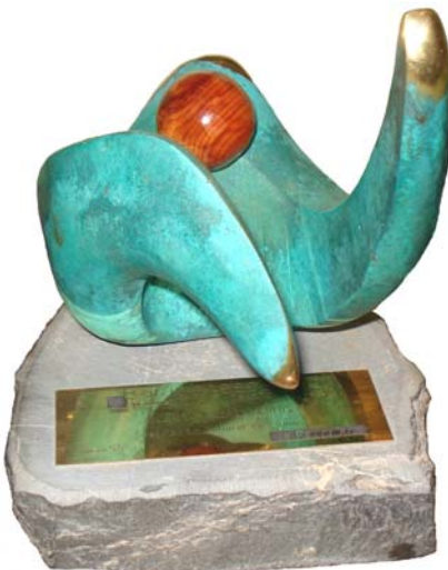
Aragonés del año Cultura 2008

Recibid con el agradecimiento de toda la Junta por vuestra colaboración y entusiasmo, el más estrecho abrazo.